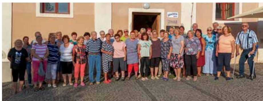
Skupina před hotelem Brdy ve Spáleném Poříčí