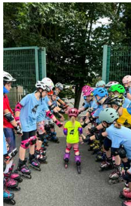
Děti na příměstském táboře Sporting Zeleneč