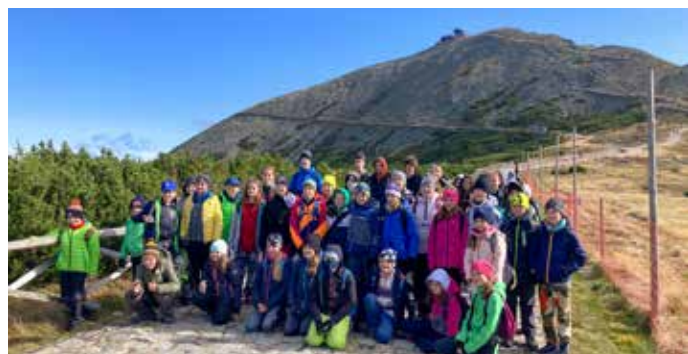
Děti 5. a 9. tříd při výstupu na Sněžku

Program zahrnoval různé tmelící hry, s důrazem na vzájemné porozumění a spolupráci kolektivu žáků. Klíčovým bodem celého výjezdu byl celodenní výstup na Sněžku, kde žáci prokázali i svou fyzickou zdatnost a kamarádství. Navíc měli možnost využít vyhříváný bazén hotelu Energetik, což přispělo k celkové pohodě a spokojenosti účastníků.