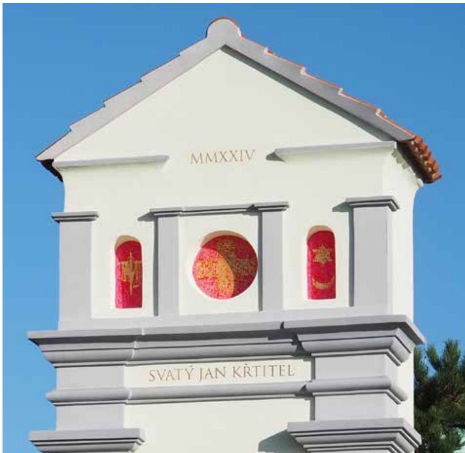
Nová výklenková kaple

stavu Jana Křtitele jaksi lidsky zpřítomnil. V pravém výklenku jsou symboly judaismu a islámu. Janův kulturní kontext a východiska jsou židovské. Jan Křtitel je ale i muslimy, kteří jej nazývají a považují jej za proroka, jenž byl seslán před prorokem Ježíšem - Isou.