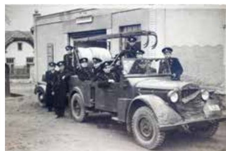
Motorová stříkačka před bývalou hasičskou zbrojnicí.