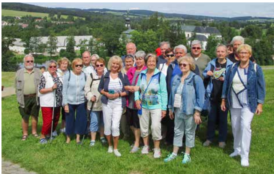
Z výletu do Žďáru nad Sázavou