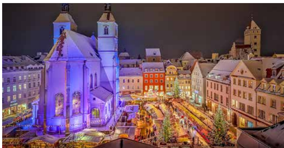
Náměstí Neupfarrplatz s adventními trhy

Výlet pořádá Obec Zeleneč výhradně pro obyvatele Zelenče.