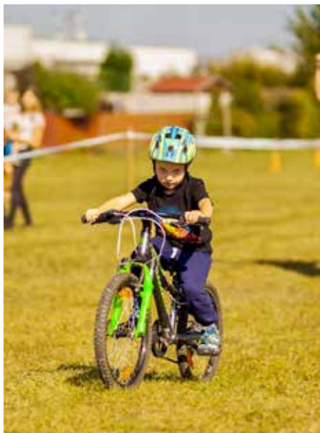
Kategorie "předškoláci", ročník 2018/2019, délka trati 700 m