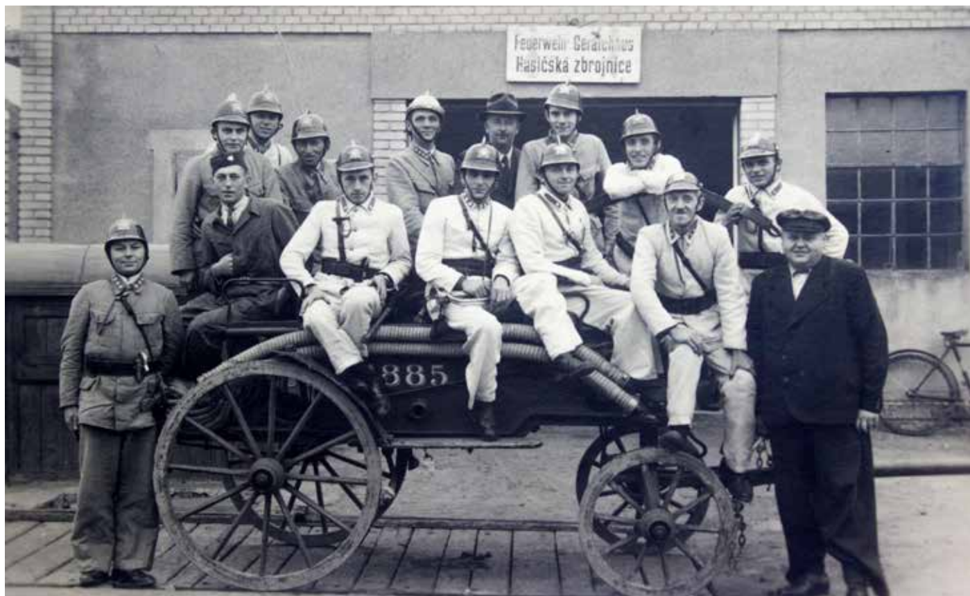
Ruční stříkačka od firmy Smékal pořízená roku 1885