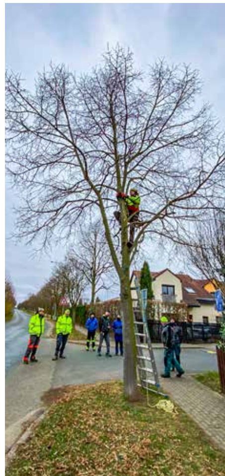
Skolení pracovníků technických služeb Pavlem Wágnerem

Vy si prostě dříve či později budete muset vzít někoho, kdo udělá celkovou koncepci zeleně v obci. Ten stav, který je tam nyní, není dlouhodobě udržitelný. Musíte si říct, co v jaké lokalitě chcete. Pak zjistit, zda je ten požadavek reálný a až pak se