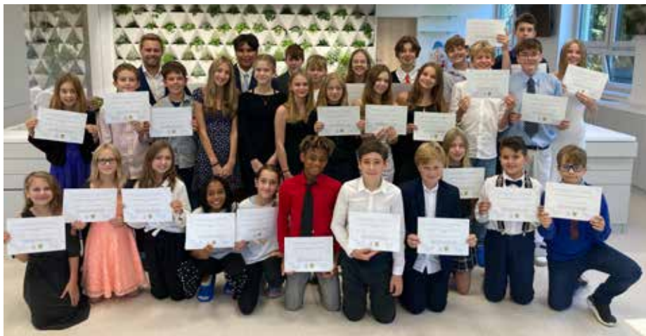
Noví členové školního parlamentu